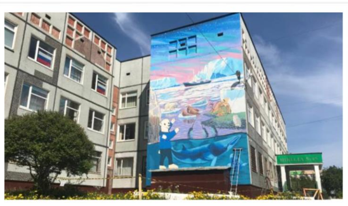
Граффити на стене школы