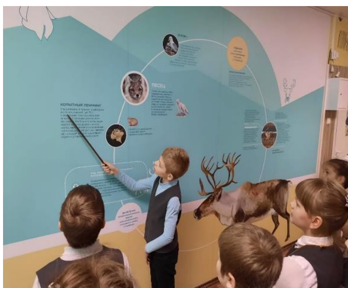
Экскурсия в школьной рекреации. «Животный мир Новой Земли».

Визит-центр Национального парка «Русская Арктика» в Северном (Арктическом) Федеральном Университете (С(А)ФУ) объединяет образовательные учреждения города в работе над проектом «Арктиковедение». На базе центра проходят мастер-классы, интерактивные занятия, экскурсии, исследовательские конференции, просмотры фильмов об Арктике, встречи с интересными людьми, интеллектуальные конкурсы, лекции ученых. В дальнейшем проект будет иметь продолжение, планируется создание программы «Арктиковедение» и книги для чтения уже для 5-8 классов.