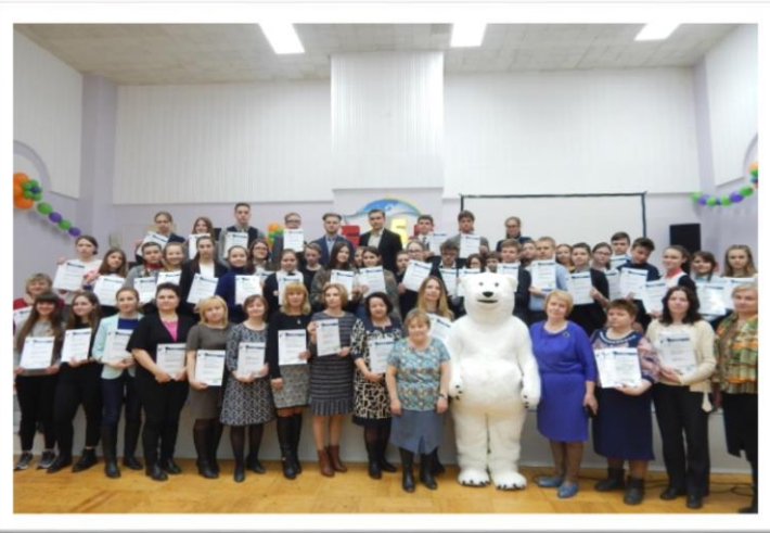
Участники Арктического диктанта (ученики и учителя)