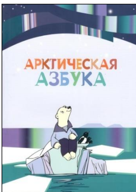
Интерактивный словарь «Арктическая Азбука»