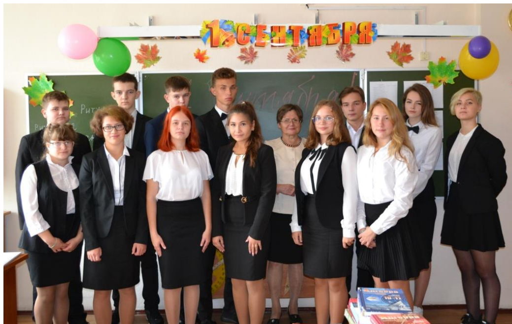
Праздник 1 сентября